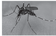
▲ヒトスジシマカ(成虫)