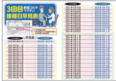
▲3回目ワクチン接種日早見表 (2回目接種から6か月経過版と8か月経過版の2種類あり)