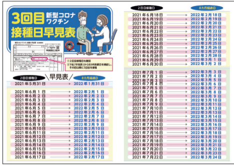
▲3回目ワクチン接種日早見表