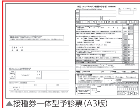
▲接種券一体型予診票 (A3版)