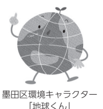
墨田区環境キャラクター「地球くん」