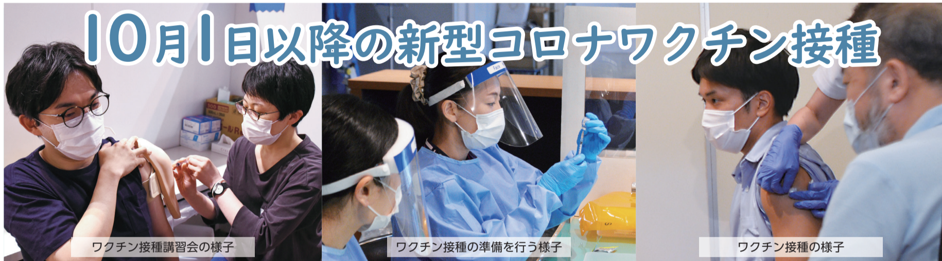
ワクチン接種講習会の様子