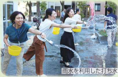
雨水を利用した打ち水