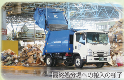
最終処分場への搬入の様子