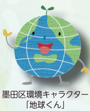
墨田区環境キャラクター「地球くん」

【申込み】期間中、直接会場へ【問合せ】環境保全課環境管理担当☎5608-6207