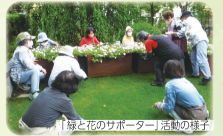
「緑と花のサポーター」活動の様子