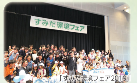
「すみだ環境フェア2019」

いま注目の「2R(リデュース・リユース)」とは？ 「古着・金属調理器具の回収、フードドライブ」をご紹介